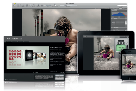
Aplicaciones de software Phocus