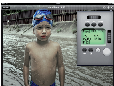
Phocus Mobile en el iPad - horizontal