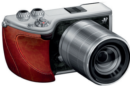
Hasselblad Lunar - Empuñadura de cuero