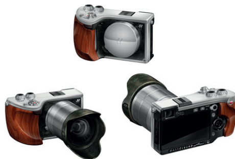
Hasselblad Lunar - Empuñadura de madera